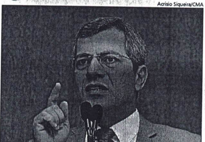
COM O PL, Iran adequará o andamento dos Processos Administrativos ao NCCPO

"Proponho que no nosso município seja regulamentado esse recurso para que o profissional da advocacia possa go-