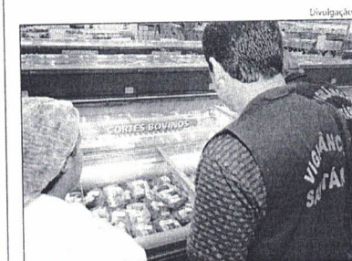
VIGILÂNCIA Sanitária estadual vai visitar supermercados