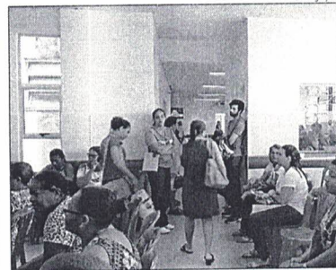
CIRURGIAS foram feitas no Hospital Regional de Estância

serem diminuídas ou zeradas atualmente, pois não há estrutura de saúde pública no Brasil que permita esse tipo de ação. A pesquisa realizada mostra também que em 750 casos a espera dura mais de dez anos. Se os dados parecem alarmantes, piora mais ainda com a informação de que os números revelados não são a real situação do país, já que cerca de dez estados, além do Distrito Federal, e oito capitais não forneceram as informações solicitadas pelo Conselho Federal de Medicina. Entre os Estados que não responderam a solicitação está Sergipe.