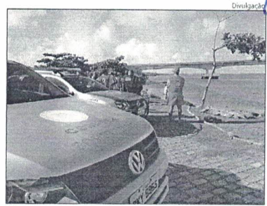
EQUIPES do Corpo de Bombeiros se revezaram na busca pelo corpo