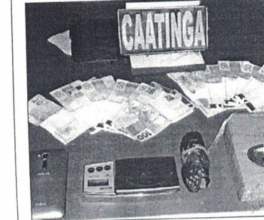
COM OS ACUSADOS a polícia encontrou drogas e uma faca