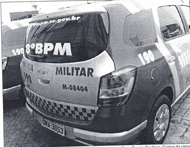
CHEGADA das novas viaturas aconteceu na manhã de ontem na Praça Fausto Cardoso, Centro da cidade

O vice-governador Belivaldo Chagas entregou 52 veículos para renovação da frota da Polícia Militar. A solenidade aconteceu na manhã desta quinta-feira (21), na praça Fausto Cardoso, no Centro da capital. "Essas viaturas irão garantir uma maior mobilidade à Polícia Militar na prevenção e no combate ao crime, como também, vem consagrar a redução de homicídios que estamos alcançando no estado graças ao investimento do governo, tanto na área da Polícia Militar como a Civil", ressaltou o secretário de Segurança Pública, João Eloy. Os veículos entregues à PM reforçarão o policiamento na capital e no interior.