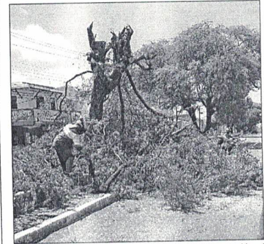
PARA A REALIZAÇÃO de poda é necessário obter uma autorização ambiental