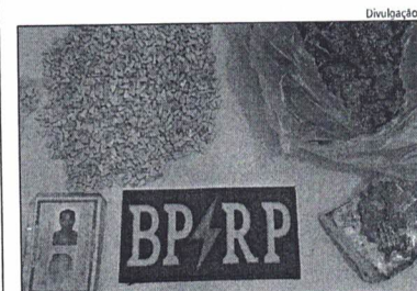
FORAM apreendidos 1,8 mil comprimidos de ecstasy, além de haxixe