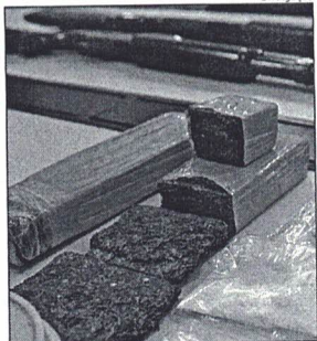
ALÉM da apreensão de armas, munição, drogas e veículos, operação resultou em três suspeitos mortos, oito presos e um menor apreendido