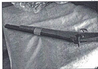
POLÍCIA CIVIL apreendeu maconha e arma